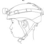
Рис./ Fig. 1